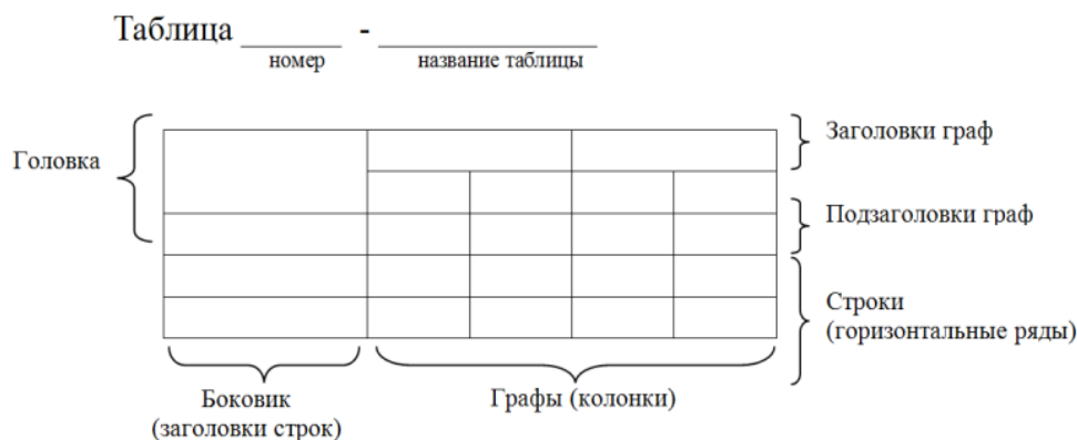
Рисунок 1 – Построение таблиц

7.20.4. Таблицу с большим количеством строк допускается переносить на другой лист (страницу). При переносе части таблицы название помещают только над первой частью таблицы, нижнюю горизонтальную черту, ограничивающую таблицу, не проводят. Над другими частями пишут слово «Продолжение» и указывают номер таблицы, например, «Продолжение таблицы 1».